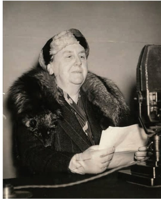
• Koningin Wilhelmina tijdens een toespraak via Radio Oranje in maart 1942 vanuit Londen.

Op 28 juli 1940 begon Radio Oranje zijn uitzendingen via de zender van de BBC vanuit Londen. Al in die eerste uitzending sprak koningin Wilhelmina tot de natie. Ze zou zich daarna nog vele malen tot haar onderdanen richten, met woorden van bemoediging en met oproepen tot verzet tegen de bezetter.