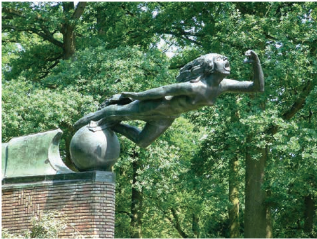
• Radiomonument in het Stadswandelpark Eindhoven (1936).

In januari 1929 sprak koningin-moeder Emma, weduwe van Willem III, via de radio de onderdanen in de koloniën toe. Het betrof de herdenking van de dag, waarop ze 50 jaar geleden met Willem III in het huwelijk was getreden.