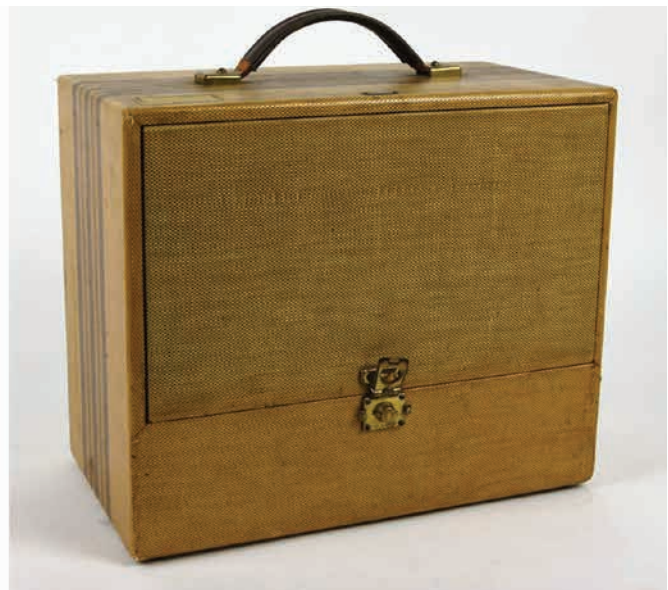
• Pilot Radio "Twin Miracle" uit 1939 van koningin Wilhelmina, gebruikt tijdens haar ballingschap in Londen (1940-1945).

In de collectie Koninklijke Verzamelingen in Den Haag bevindt zich een radiotoestel dat koningin Wilhelmina tijdens haar ballingschap in WO II (1940-1945) in Londen zou hebben gebruikt. Het betreft een kofferradio van het Engelse merk Pilot Radio, in een met canvas overtrokken behuizing en voorzien van een hengsel en slot. Het toestel met de naam "Twin Miracle" is geschikt voor ontvangst van de middengolf en langegolf. Het is een 5-lamps toestel, gevoed met wisselstroom uit het net (200-250 V) of met een batterij of accu van 1,5 V voor de gloeistroom en van 90 V voor de anodestroom. De afmetingen bedragen b x h x d = 34 x 18,5 x 19 cm.