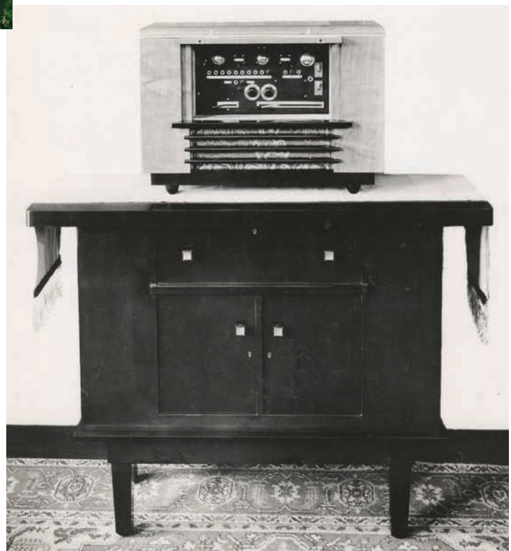
• "Koninginnetoestel" met de NSF W1 in een door Dudok ontworpen kast plus onderkast (1925).