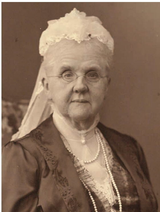
• Koningin-moeder Emma in 1920.

Het grote publiek in ons land werd pas echt met het thema radio geconfronteerd toen de in 1916 opgerichte NVVR (Nederlandsche Vereeniging voor Radio-Telegrafie) tentoonstellingen ging organiseren. Dat gold ook voor de leden van het Koninklijk Huis, die door hun aanwezigheid bij deze tentoonstellingen en door bezoeken aan radiofabrieken van hun belangstelling voor deze materie blijk gaven. Hierna volgt een greep uit evenementen waarbij leden van het Koninklijk Huis vertegenwoordigd waren.