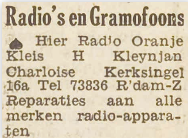
• Advertentie in Het Vrije Volk van 10 juli 1947.

In mei 1947 schrijft Kleis Kleijnjan zijn bedrijf voor het eerst in bij het Handelsregister van de Kamer van Koophandel in Rotterdam met de handelsnaam "Hier Radio Oranje" en met als werkgebied 'winkel in radiotoestellen en -onderdelen, elektrische artikelen en radio-reparatie-inrichting'. Dit wijst niet op enige activiteit, althans zeker niet grootschalig, in de richting van de fabricage van radiotoestellen. Ook de allereerste advertentie die ik heb kunnen ontdekken (van 10 juli 1947) rept niet over een eigen productie van radiotoestellen.