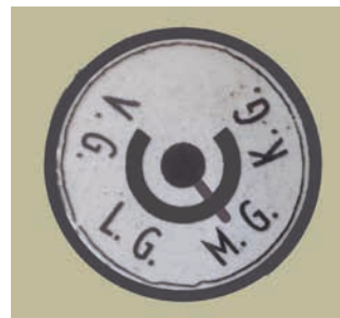
• Op de afstemschaal laat een klein wijzertje zien op welke band is afgestemd (op de foto is dat de MG). Het wijzertje wordt via een schaalkoordje door de bandenschakelaar bediend.

De bekrachtigde luidspreker is van het Belgische fabricaat Socora. De stations op de afstemschaal hebben Nederlandse namen en op de rand van de schaal staat "GR Carpentier", mogelijk een verwijzing naar de familie Carpentier van het Belgische merk Carad. Behalve de gebruikelijke banden LG, MG en KG toont de schaal ook de visserijband (VG). Op de afstemschaal bevinden zich in de verflaag drie ronde uitsparingen. Links boven zit daarachter het afstemoog en rechts boven een kleine wijzer, die aangeeft op welke band is afgestemd. De functie van de ronde uitsparing midden rechts is onduidelijk.