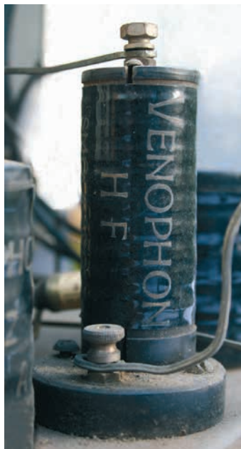
Venophon HF smoorspoel.

Bijzonder is dat de twee spoelen en de hoogfrequent smoorspoel mogelijk van eigen fabricaat zijn. Ze dragen in elk geval met grote letters het opschrift VENOPHON.