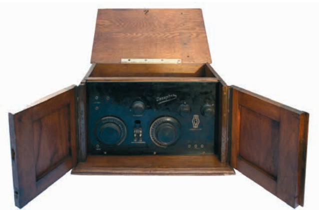
4-lamps Venophon-accutoestel met twee individuele condensatoren voor de afstemming (plus terugkoppelcondensator). Collectie: Koen Holleman.

Tijdens het schrijven van dit artikel ontdek ik het bestaan van een tweede Venophon-toestel. Het is in het bezit van verzamelaar en NVHR-lid Koen Holleman.