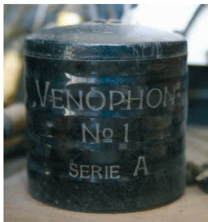
Venophon spoel No 1 serie A.

Ook deze Venophon is een 4-lamps accutoestel voor de ontvangst van middengolf en lange golf en ondergebracht in een eikenhouten kast met twee klapdeurtjes. Het schema van dit toestel is in grote lijnen hetzelfde als het schema hierboven. De antennekring en het laagfrequent gedeelte zijn nagenoeg hetzelfde. Ook hier kan op de derde lamp een hoofdtelefoon en op de vierde lamp een luidspreker aangesloten worden. Met welke lampen dit toestel indertijd mogelijk was uitgerust is niet vast te stellen. De lampen bij dit toestel ontbreken namelijk en ook de koppeltrafo, die het laagfrequentsignaal van de detector naar de derde lamp voert, is niet meer aanwezig. Een belangrijk verschil is dat de eerste lamp een gewone triode is en dat de twee afstemcondensatoren individueel afgestemd moeten worden (zitten niet op één as, zoals bij het eerste toestel).