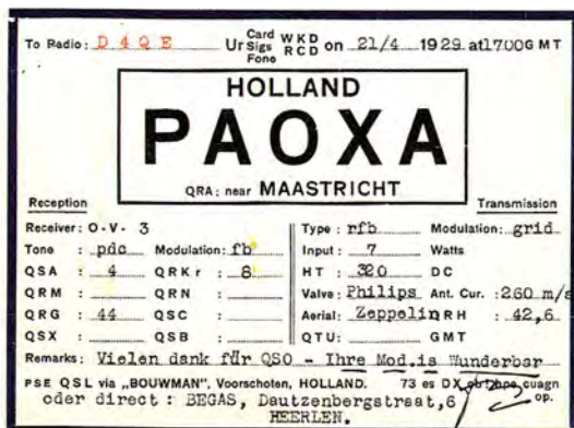
QSL-kaart van P. Begas (PAOXA) in de collectie van het QSL-kaarten-museum.

P. Begas was ook radiozendamateur en bediende zich in dat verband van de roepletters PAOXA. In het QSL-kaartenmuseum bevindt zich een QSL-kaart van een verbinding die hij op 21 april 1929 maakte met het Duitse amateurstation D4QE. De gebruikte ontvanger was een 0V3; de zender werkte met roostermodulatie en een ingangsvermogen van 7 watt. De installatie was aangesloten op een Zeppelin-antenne.