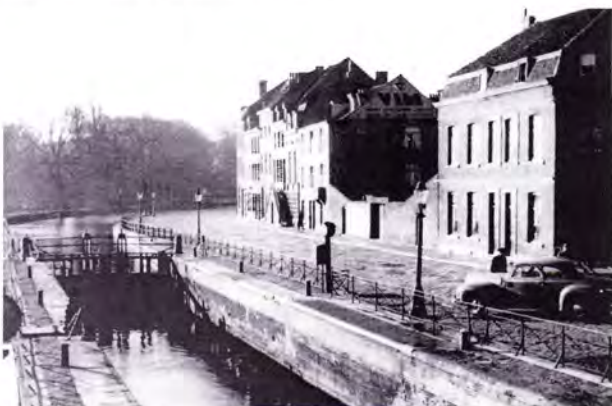
O.L.V. kade 1 in Maastricht (Foto: collectie fam. Begas).

P.A.A. (Pierre) Begas werd geboren op 28 augustus 1898 in Oud-Vroenhoven (bij Maastricht).