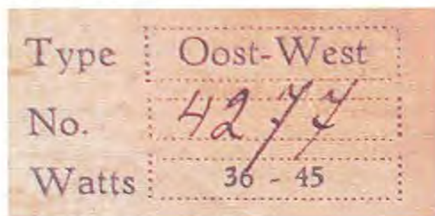
Typeplaatje model 4 (1940-1941).

Model 4 treffen we aan in de jaren 1940-1942 (type 138,5, 168, 215, 265, HI, Insulinde en Oost-West). De eerste typeplaatjes na WO II zijn trouwens ook van papier, maar dan wel bedrukt.