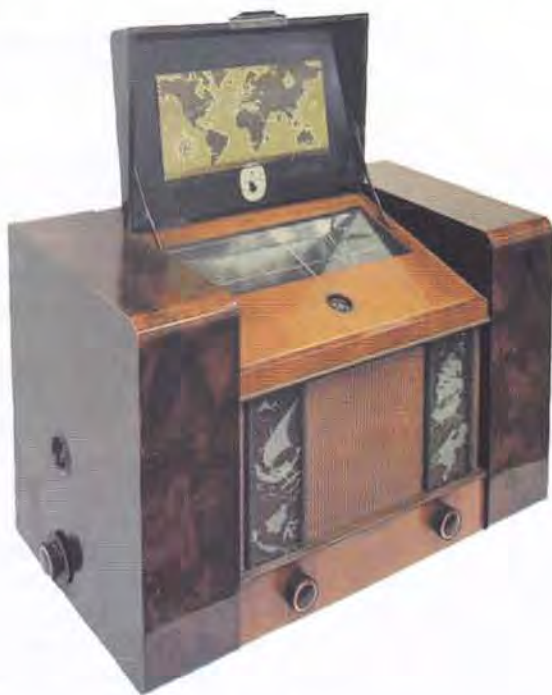
Waldorp Insulinde uit 1941 in een Russisch radiomuseum, afkomstig van het Ostspende-project van Goebbels. Het Ostspende-label bevindt zich onder de opengeklapte wereldkaart.