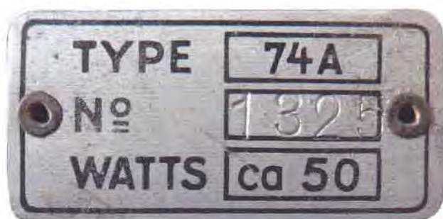
Typeplaatje model 2 (1935-1938).