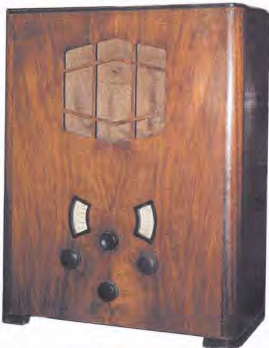
Waldorp 34A uit 1933/1934, waarvan door verzamelaars maar één exemplaar is aangemeld. Foto: auteur, collectie: Jeroen Landman.

Het totale aantal door Waldorp geproduceerde toestellen kan bepaald worden door de productiegrootte van alle types bij elkaar op te tellen. In die gevallen dat voldoende en eenduidige gegevens over serienummers bekend zijn, kan de productiegrootte van een type daaruit worden afgeleid. Zo vormen de verzamelde serienummers voor het type 34 een vrijwel aangesloten reeks van het laagste waargenomen nummer 102 tot het hoogste nummer 457. Uitgaande van de aanname dat de complete reeks serienummers hier het traject van 101 tot en met 500 omvat, leidt dit tot een totaal van 400 geproduceerde stuks. Bij enkele types wordt de reeks serienummers eenmaal of enkele malen onderbroken; daar heb ik bij het schatten van de productiegrootte rekening mee gehouden. Van enkele types zijn weinig serienummers beschikbaar of zijn de gegevens niet eenduidig. In die gevallen heb ik gebruik gemaakt van de