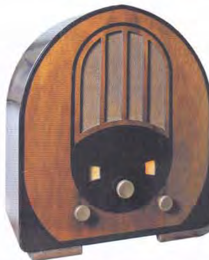
Waldorp 516WL uit 1932/1933, het enige door verzamelaars aangeelde exemplaar.