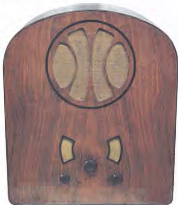
Waldorp 23T uit 1934/1935.