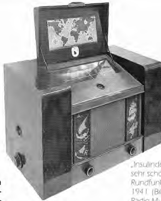
„Insulinde“ von Waldorp ist ein sehr schönes niederländisches Rundfunkgerät aus dem Jahr 1941.

Im April 2010 entdeckte der Autor ein Exemplar des „Insulinde“ von Waldorp. Das Gerät wurde auf der Webseite des russischen Sammlers VALERY GROMOV angezeigt, Eigentümer des RKK Radio Museums in Moskau. Es handelt sich um ein sehr schönes Rundfunkgerät aus dem Jahr 1941, hergestellt von N.V. Nederlandse Instrumentenfabriek Waldorp in Den Haag. Es ist ein Radio für Wechselstromspeisung, ausgestattet mit fünf Röhren (ein „magisches Auge“) für Lang-, Mittel- und Kurzwellenempfang. Über der pultförmigen Skala befindet sich ein aufklappbarer Deckel mit